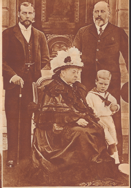
Vier Generationen einer Dynastie. Stehend: Königin Viktoria von England, rechts oben ihr Sohn Edward VII. links dessen Sohn, der junge König George V., dessen 25jähriges Regierungsjubiläum in diesem Sommer gefeiert wird, rechts unten der Prinz of Wales im dritten Alterjahre. Das Bild erinnert an den Jahr 1897. Königin Viktoria war eine Herrscherin von ganz großem Format. Sie wurde 1819 geboren, bestieg den Thron 1837 und regierte bis 1901, volle 64 Jahre lang. Von ihren neun Kindern bestieg die älteste Tochter den deutschen Kaiserthron, den Vater Wilhelm II. Nach ihrem Tode (1901) bestieg ihr Sohn Edward VII. den Thron von England. 1841 geboren, war er bei seiner Thronbesteigung schon 62 Jahre alt. Er regierte nur neun Jahre. Seit 1863 war er mit Prinzessin Alexandra von Dänemark verheiratet. Der Ehe entsprangen fünf Kinder. Der älteste Sohn Clarence starb früh, der zweite wurde als George V. sein Nachfolger auf dem Thron, die jüngste Tochter Maria heiratete den jetzigen König Haakon VII. von Dänemark. George V. bestieg den Thron von England am 6. Mai 1910. Im Herbst desselben Jahres wurde er in Delhi zum Kaiser von Indien gekrönt. Selber nicht als Herrscher, der faktisch weit weniger Macht besitzt als der Präsident der Republik Frankreich oder der Präsident von U. S. A., wie ein Symbol für die Zusammengehörigkeit des riesigen britischen Weltreiches in der Spitze der Monarchie.

In diesem Jahr begeht George V. das Jubiläum seiner 25jährigen Regierungszeit als König des Vereinigten Königreichs von Großbritannien und Nordirland, der Britischen Dominions jenseits der See und als Kaiser von Indien. George V. folgte 45jährig am 6. Mai 1910 seinem Vater Edward VII. auf den Thron. Seine Popularität ist groß, und seine politische Initiative, die er in ihrem verflochtenen Vierteljahrhundert mehrmals bewiesen hat, beschränkte ihm auch den Namen eines erfolgreichen Staatsmannes. Hierzu kommt ein gewisser Stolz und aufrichtige Freude des ganzen Volkes über die lange Dauer seines Regimes. Großbritannien und besonders London werden in diesem «Jubilee Year» im Zeichen von Festlichkeiten stehen, wie sie die Welt und das Empire seit langem nicht mehr erlebt haben, und wie sie ein anderes Land als diese demokratische Monarchie auch nicht feiern könnte.