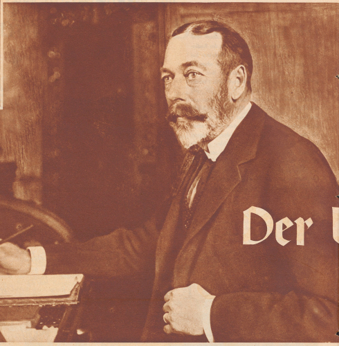
George V. König von England und Kaiser von Indien. Er ist geboren am 3. Juni 1865 in Marlborough House, als zweiter Sohn Edwards VII. und der Königin Alexandra. Als Nachfolger seines Vaters bestieg er am 6. Mai 1910 den Thron von Großbritannien.

Das silberne Regierungsjubiläum König George V. von England