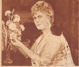
Königin Mary von England, geborene Ffrench, die sie seit 67 Jahre alt und seit 1893 vermählt mit George V.