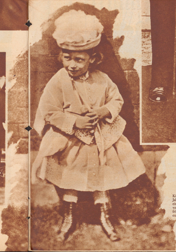
König George vier Jahre alt. Er ist das einzige Bild, das von ihm aus seiner früheren Kindheit existiert.