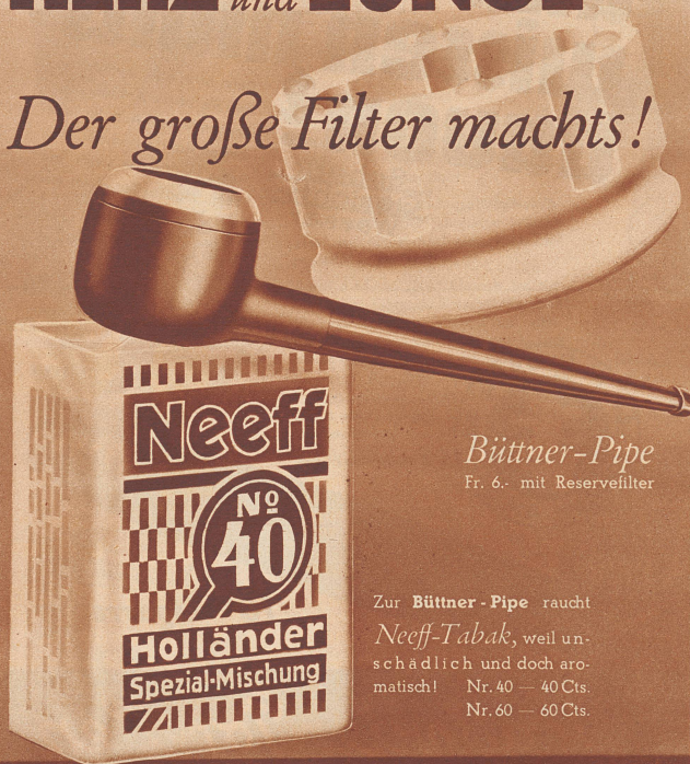
Böttner-Pipe Fr. 6.- mit Reservefilter

Zur Böttner-Pipe raucht Neeff-Tabak, weil un- schädlich und doch aro- matisch! Nr. 40 — 40 Cts. Nr. 60 — 60 Cts.