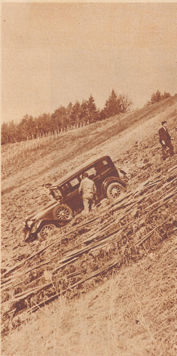
Ein Autounfall, der gut ausging. Es sieht eigentlich ganz gefährlich aus und leicht hätte es auch gefährlich werden können. Der Autolenker wollte auf einem schmalen Sträßchen einem Hasen ausweichen und rutschte dabei über den Straßenrand hinaus. Zuerst ging es eine Weile ganz steil bergab und erst nach einiger Zeit konnte der Mann im Wagen stoppen. Mitten im Keberg ist er gelandet. Vorne war das Auto stark beschädigt und es war eine große Mühe, den Wagen wieder aufs Sträßchen zu bringen.