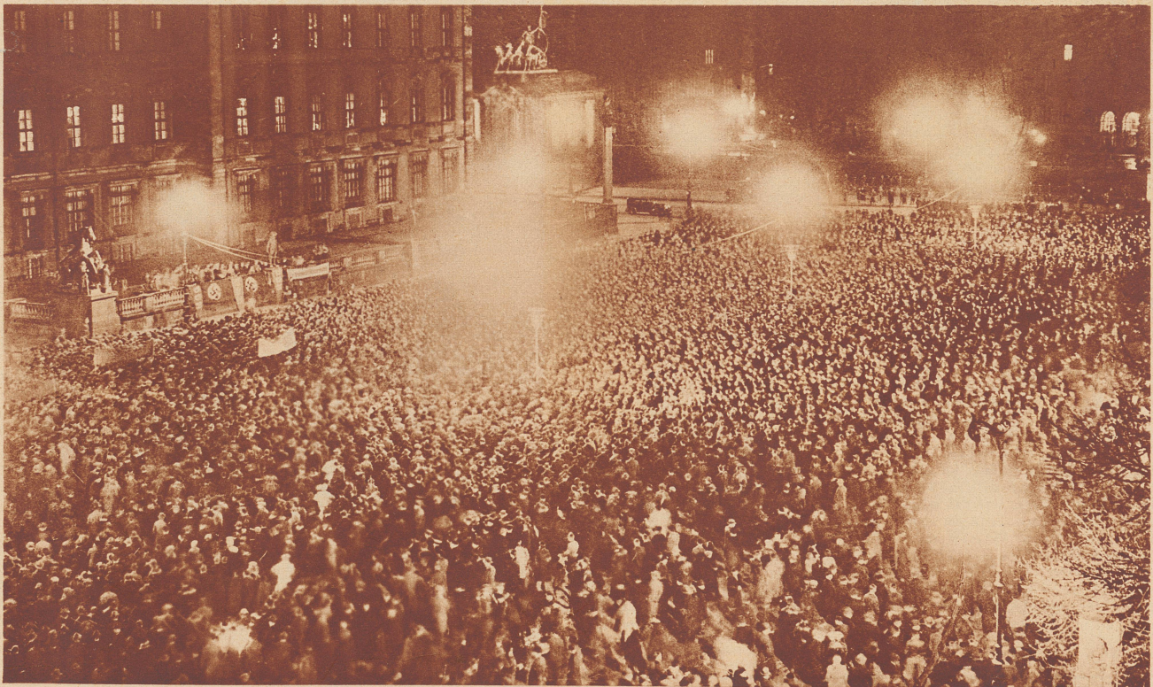
In Berlin: Riesenprotestversammlung am 27. März im Berliner Lustgarten. Dieser Protest richtet sich gegen das Urteil im Hochverrats- und Femenmordprozeß von Kowno (Litauen), bei welchem vier Memeldeutsche zum Tode, zwei zu lebenslänglichem Zuchthaus und zwanzig zu Zuchthausstrafen von 2 bis 12 Jahren verurteilt wurden. In zehn andern deutschen Großstädten fanden ebenso wuchtige Protestkundgebungen wie in Berlin statt.