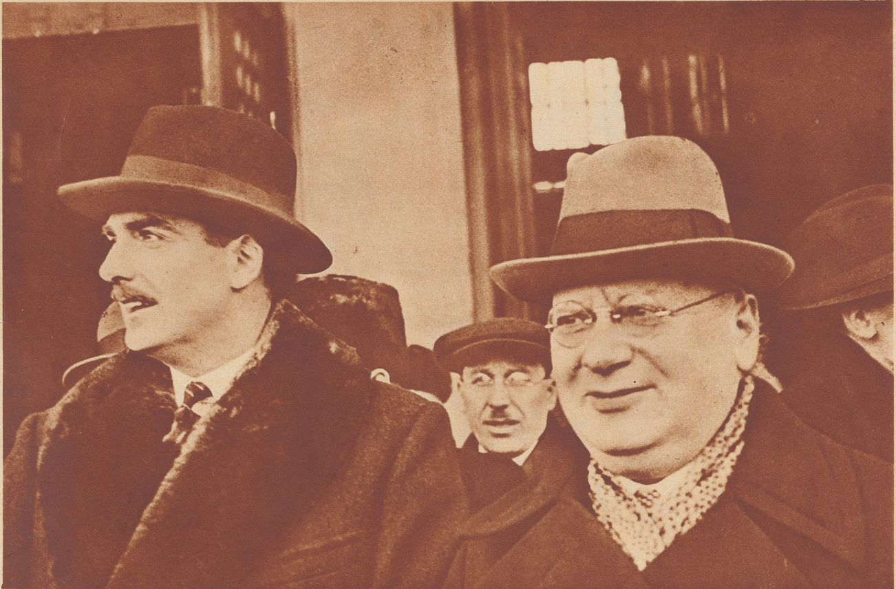
In Moskau: Sir Anthony Eden, der britische Lordsiegelbewahrer, ist am 28. März zu großen politischen Besprechungen in Moskau eingetroffen. Unser Bild zeigt ihn (links) mit dem russischen Volkskommissär Litwinow bei der Ankunft im Weißrussisch-Baltischen Bahnhof in Moskau.