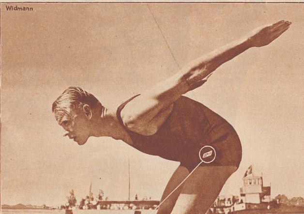
Weltmeister Arne Borg trägt Jsa Schwimmanzug Form 189