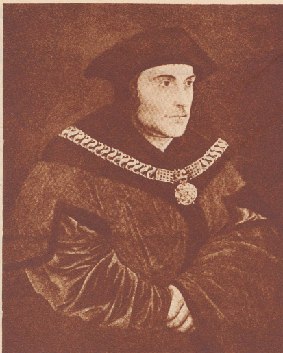
Sir Thomas More

«Na, und? Was geht das mich an?» «Können Sie nicht lesen? Jugendlichen unter sechzehn Jahren ist der Eintritt verboten!»