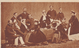
Ein Bild vom Dänischen Hof aus der Zeit kurz vor Ausbruch des Preussisch-Dänischen Krieges im Jahre 1864. Von links nach rechts: Kronprinz Christian, der spätere König Christian IX., von Dänemark, die spätere Königin von Dänemark, hinter ihr Prinz Wilhelm, Sohn Christian und späterer König von Griechenland, rechts von ihm der Kronprinz von Preußen, rechts außen im Vordergrund steht die Kronprinzessin von Preußen, hinter ihr Prinzessin Dänemark, die spätere Kaiserin von Rußland und Mutter des kaiserlichen Nikolaus II. Hinter dem Thron stehen die Prinzessinnen von Watten. Die Prinzessin Alexandra war die Tochter Christian IX. Kurz nach dieser Freilichtszene gab es Krieg zwischen Dänemark und Preußen, und der preussische Kronprinz marschierte als Kommandierender einer Armee gegen Dänemark.

Die Dänen marschierten ein und schlugen die Aufständischen in mehreren Gefechten. Von Berliner und Wiener dynastisch-reaktionären Standpunkte aus war die Niederlage der Elbherzogtümer eine erfreuliche Wendung, und der Preussenkönig hätte es am liebsten dabei ge-