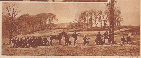
Ein Kriegsbild aus jener Zeit, da der Krieg noch nicht so gefährlich war wie heute: die Verluste des Brandenburger Jägerbataillons im Gefechtsfeld bei Osterlapp. Bezeichnend ist die Art der Truppenverteilung und die Art der Vergräbnisse dieser Vorkriegszeit. Damals war es ungewöhnlich, so ungeschützt und nicht aufgezogen vorzugehen. Es war kein Flugrohrbatterei und keine Freyschärze im diesem Schlachtenweise zu befürchten.

Die erste Reihe der Kriege um Schleswig-Holstein fand im Jahre 1852 mit dem Londoner Vertrag ihren formalen Abschluß. In London wurde die Ausdehnung der weiblichen Erbfolge auf Schleswig-Holstein auch durch Preußen und Österreich anerkannt. Dänisch-schleswig-holsteinischer Thronfolger wurde demzufolge Prinz Christian aus dem Hause Glücksburg, der die erfolgreichste Kaiserin des Königs Friedrich VII. heiratete. (Fortsetzung Seite 62)