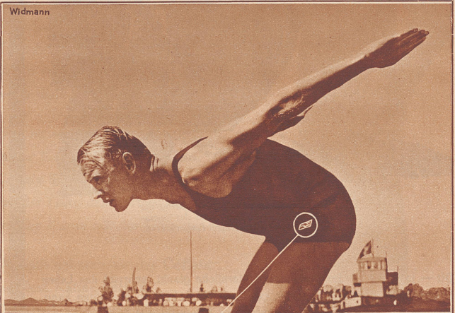
Weltmeister Arne Borg trägt Jsa Schwimmanzug Form 189