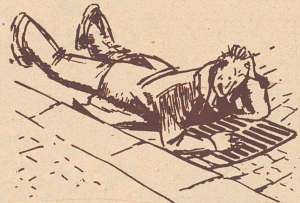
«Oh weh, jetzt haben sie mich erwischt!!»

«Das ist doch nicht schwer ... erstens ist das Papier rosa, zweitens sitzt die Briefmarke schief ... na, und drittens ist der Umschlag unterwegs aufgegangen ...»