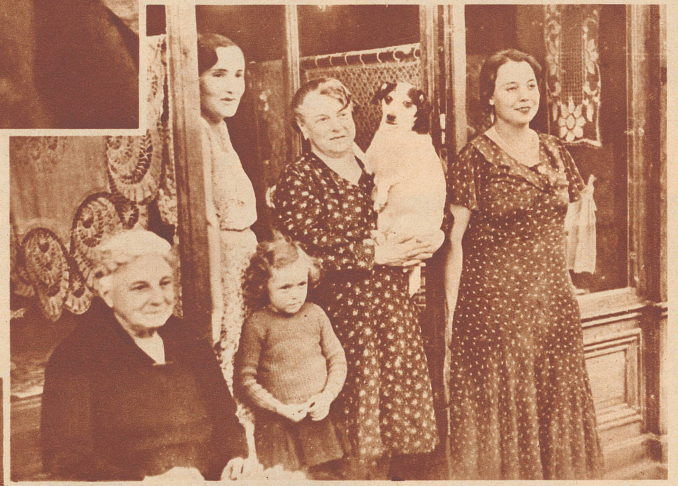
Die Familie vom Laden nebenan schaut dem Straßenphotographen zu, wie er zwei junge Mädchen, die eitel und scheu zugleich sind, abknipst. Kurze Zeit nachher hat man sich entschlossen, auch noch zu einer Aufnahme zu «stehen».

An Festtagen und großen Rummeln ist der Straßenphotograph in südlichen Ländern eine Figur, die so wenig wegzudenken ist wie die Limonadeverkäufer und der Mann, dessen Affen auf einem Seil tanzen. An solchen Tagen, da tragen die Schönen aus dem Volke ihre besten Kleider, die Männer sind frisch rasiert, und wer freute sich nicht darüber,