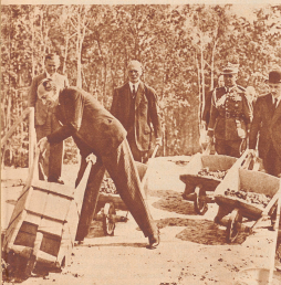
Die Minister mit den Schiebkarren.

Die drei großen Basler Congressen, Basler Liedertafel, Basler Männerchor und Basler Liederkreis bereiten im grossen Saal des eidgenössischen Sängereid unter Leitung von Hans Ulrich Händels großes Chorwerk «Alexanderfest» oder «Die Macht der Musik» an. Die Wiederholungen finden am 5. und 6. Juli statt. Bild: Der über 600 Musikanten zählende Congress in der grossen Kesselhalle des Motorseilgebäudes während des Begleitkonzertes.