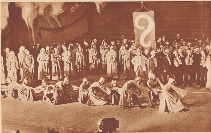
Szene aus dem Festspiel «Mutterland» vom Eidgenössischen Sängerverein.

Die dünnen Gestalten der Fragezeichen-Gruppe versanden Freude und Begeisterung der Sänger durch Unglauben und dankte Prothesen zu dem