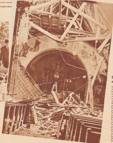
Die Erde bebte am 27. Juni.

Auf dem Gelände des Wavel-Schlosses in Krakau wird für den verstorbenen Marschall Pilsudski ein Ehrengrab errichtet. Unsere Bild zeigt die Mitglieder der jetzigen polnischen Regierung, die zu Beginn der Erbauungsarbeiten sich an der Errichtung dieses Ehrengrabes persönlich beteiligen. Im Vordergrund Außenminister Beck, der erste Minister von Swiatkiski, Präsident des polnischen Parlaments, in der Uniform der Generalspizke der polnischen Armee, General Rydz-Smigly.