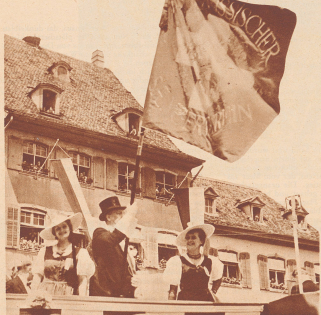
Übergabe der eidgenössischen Sängertafel auf dem Münsterplatz in Basel.