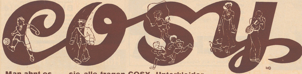
Man ahnt es . . . sie alle tragen COSY-Unterkleider

Nervenschwäche der Männer, verbunden mit Funktionsstörungen und Schwinden der besen Kräfte. Wie ist dieselbe vom Standpunkte des Spezialarzes ohne wertlose Arzneimittel zu verhüten und zu heilen. Wertvoller Raigeber für jung und alt, für gesund und schon erkrankt: illustr., neubearbeitet unter Berücksichtigung der modernsten Gesichtspunkte. Gegen Fr.1.50 in Briefmarken zu beziehen von Dr. med. Hausherr, Verlag Silviana, Herisau 472