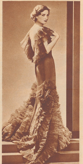
Festliches Abendkleid aus Seidentüll mit reichen, schleppenartig auslaufenden plissierten Volants.

rend des ganzen Sommers bewährt. Mit Rüschen und Schleifen ist nicht gespart worden, auch die Farben sind äußerst vielfältig. Als neueste Schöpfung wird Cellophan gleichzeitig mit Tüll und Taft verarbeitet. Aber es scheint, daß sich dieses Material nicht so recht durchzusetzen vermag. Es ist allzu kunstgewerblich, und die Frauen, die sich sonst gerne emanzipiert und sachlich geben, lieben es, sich des Abends in Gewänder zu hüllen, die nicht nur im Stil, sondern auch im Stoff an die Zeiten erinnern, in denen die Großmütter junge Mädchen waren.