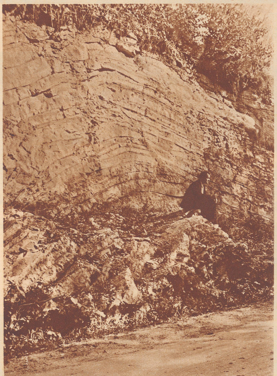
Rein und klar, vollendet schön, ist an einer Wegknickung, ein Viertelstündchen oberhalb Kienberg, eine Gebirgsfalte blößgelegt.

Falten aller Form und Größe können wir zu Hunderten im Jura feststellen; denn das ganze Juragebirge ist ein einziger, großartiger Faltenwurf. Die Schichten, die wir an ihnen erkennen, haben sich während Jahrhunderttausenden in den Tiefen der Meere gebildet. Allerlei versteinertes Getier, wie es einst nur die Meere bergen konnten, sind untrügliche Beweise dafür. Doch waren diese Schichten anfangs alle eben, waagrecht wie ein ausgebreitetes Tischtuch auf der Tischplatte. So legte sich mit den Jahrtausenden im Meeresgrund Schicht auf Schicht.