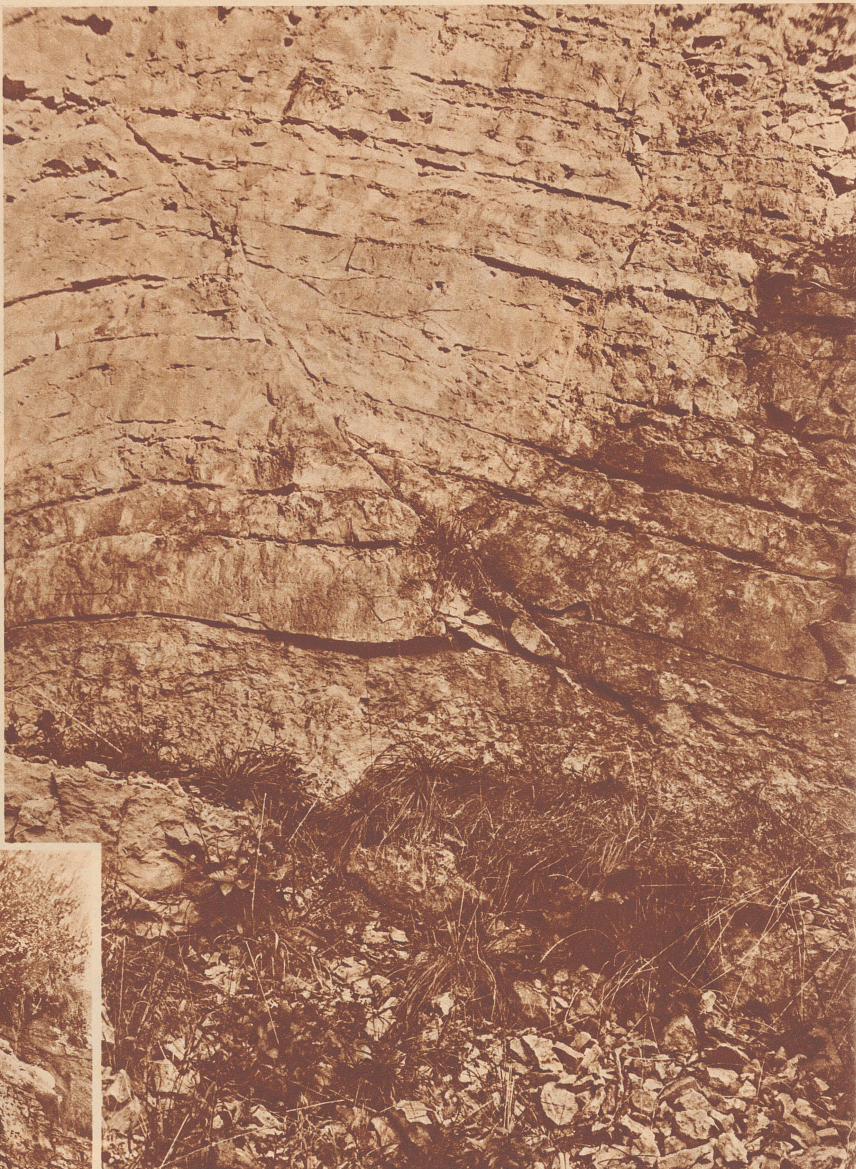
Ohne Krachen und Knacken kann sich die Faltung nicht vollzogen haben; denn schräg durch den Gewölbescheitel zieht sich unverkennbar ein Bruch, durch den die Schichten auf der linken Seite um einige Dezimeter abgesunken sind.

Eine Falte ist's. Auch anderswo bilden sich solche. Unsere Haut legt sich in Falten, wenn wir altern, die Haut des Apfels, wenn er bei langem Lagern zusammenschrumpft. Was ist die Erdkruste anderes als eine dünne Haut? Denn was bedeuten 60 bis 80 Kilometer Dicke am Leib unseres Planeten, der im Durchmesser 12 700 Kilometer ausmacht? Es entspricht gerade etwa der Stärke des Kartons an einem Globus. Und diese Haut sollte nicht schrumpfen, sich nicht falten können? Wir haben allerdings Mühe, uns vorzustellen, wie diese 60 bis 80 Kilometer dicke, steinerne Haut unserer Mutter Erde sich zu Falten büschelt wie eine Serviette. Aber wir brauchen also bloß beim Sträßeneinschnitt oberhalb Kienberg die Augen aufzumachen, um uns von dieser Tatsache zu überzeugen.