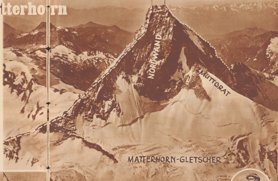
Das Matterhorn von Nordwesten aus 5000 Meter Höhe. Strichirte Linie: Route von Whymper und Genoves. Punctirte Linie: Route von Carrel.