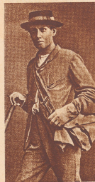
Edward Whymper zur Zeit seiner Matterhornbesteigung.