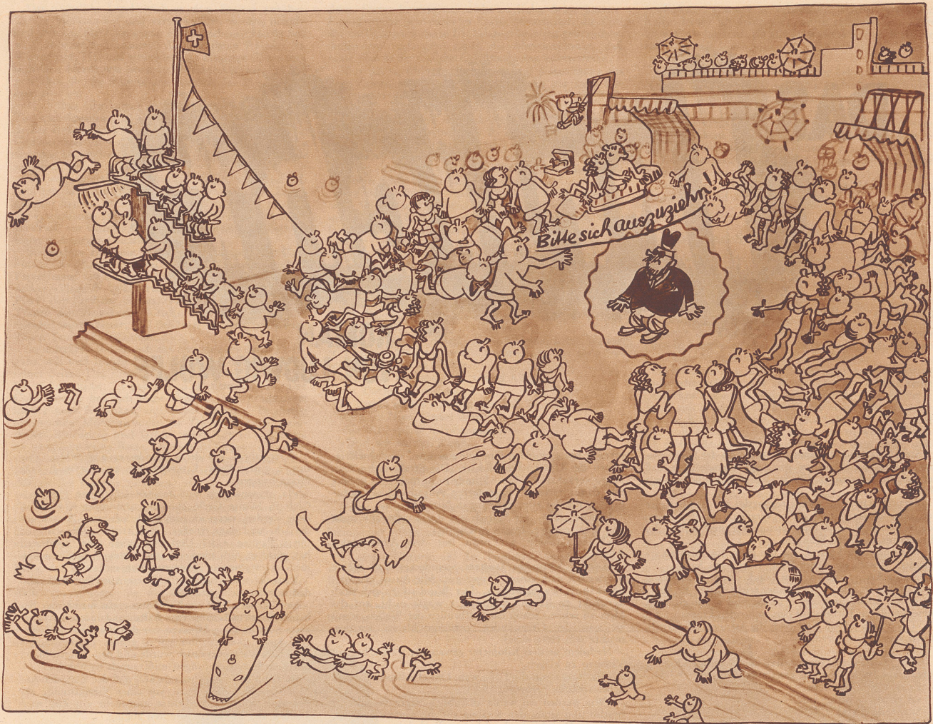
Das Strandbadleben jetzt