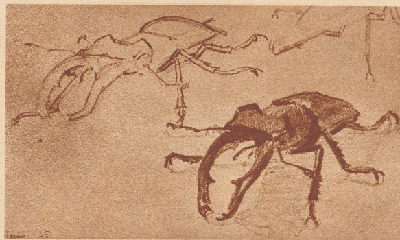
Das ist die Zeichnung meines Bruders.