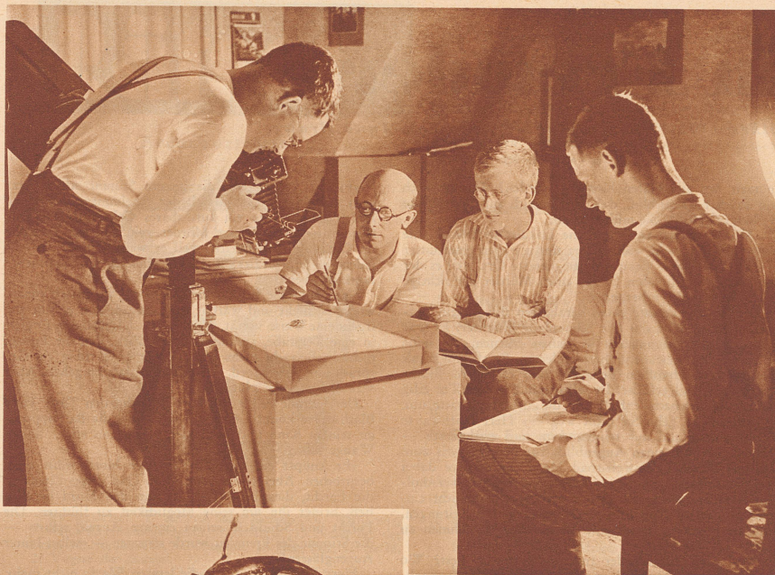
Wir haben den Käfer hell beleuchtet und mein Bruder photographierte ihn.