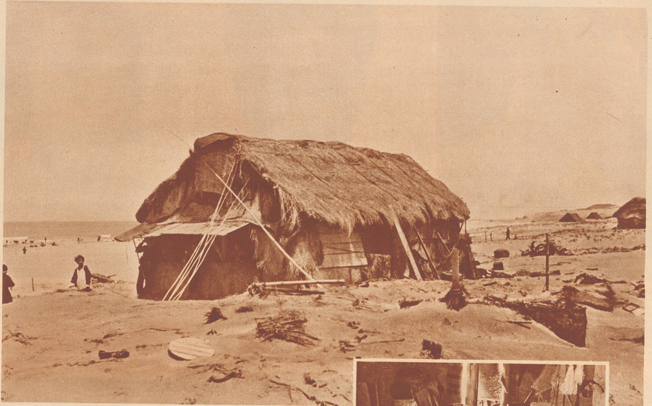
Auf dem weiten, breiten Sandstrand von Niigata, an der zurückgebliebenen Westküste der japanischen Hauptinsel Hondo, stehen in kleinen Gruppen die armseligen, fensterlosen Hütten der Fischer. Um die Hütten herum liegen Schmutz und Abfälle. Wie sich diese schwachen Bauwerke gegen die wilden Stürme dieser Breiten halten können, ist ein Rätsel.