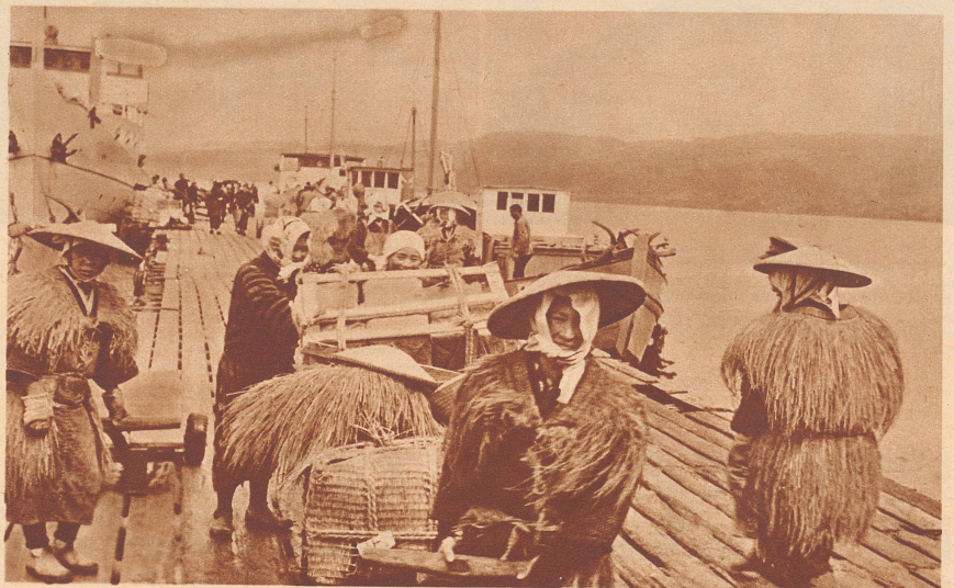
Die Fischer bringen ihre Beute zum Händler. Sie tragen Strohhüte und Strohmäntel bei jeder Witterung. Diese geben ihren Trägern Schutz gegen Regen, Wind und Kälte ebensogut wie gegen den heißen Sonnenschein.