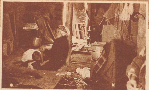
Blick in das Innere einer japanischen Fischerhütte. Draußen auf dem Strand liegt strahlender Sonnenschein. In der Hütte ist es dunkel wie am Abend. Es herrscht große Unordnung. Neun Menschen bewohnen den Raum. Das einzige, was daran erinnert, daß wir nicht tausend Jahre zurückversetzt sind, sondern im Jahre 1935 leben, sind die maschinengewebten Baumwollkleider der Bewohner.