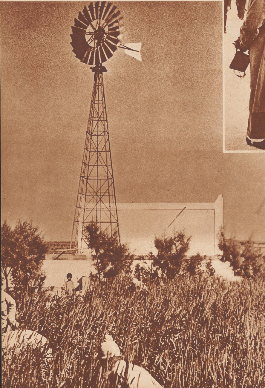
Ein Weizenfeld in der Wüste. Vor wenigen Jahren waren hier noch Sanddünen; soweit das Auge reicht nichts als gelber, heißer Sand. Der Weizen ist jetzt etwa 1,30 Meter hoch, drei Monate alt, aber noch nicht ganz ausgewachsen. Die Ernte erfolgt Ende des vierten Monats nach der Aussaat. Zum Schutze gegen den trockenen Flugsand mit sich führenden Wüstenwind sind die Felder mit Tamarix-Sträuchern umsäumt. Im Hintergrund die Quelle alles Lebens — der erbohrte Brunnen. Die Windmühle befördert das kostbare Wasser aus vielen Metern Tiefe in die davor liegende Zisterne. Von hier aus erfolgt durch Kanäle die Verteilung in die Felder.

Drei für die koloniale Erschließung, Entwicklung und Verwaltung Italiens in Afrika bedeutsame Männer: Von links nach rechts: Conte Volpi di Misurata, langjähriger Gouverneur von Tripolis und der Cyrenaica, General Graziani, der gegenwärtige Oberkommandant der italienischen Truppen in Ostafrika und der aus dem Weltkrieg bekannte Marschall Badoglio, der ebenfalls ein paar Jahre Gouverneur der nordafrikanischen Besitzungen war. Außer diesen drei Männern haben sich auch General de Bono und in jüngster Zeit General Balbo administrativ erfolgreich in Afrika betätigt.