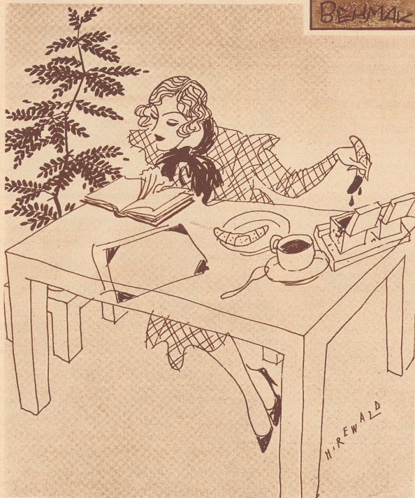
Der spannende Roman.

«Nachdem Sie also den Geldschrank erbrochen und sich der Kasse bemächtigt hatten, was taten Sie dann?» Der Angeklagte: «Ich schlich mich fort, leise und vorsichtig wie ein Dieb!»