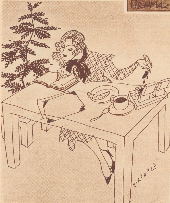
Der spannende Roman.

«Nachdem Sie also den Geldschrank erbrochen und sich der Kasse bemächtigt hatten, was taten Sie dann?» Der Angeklagte: «Ich schlich mich fort, leise und vorsichtig wie ein Dieb!»