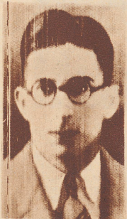
Der Attentäter: Dr. Karl Weiss. Er wurde nach der Tat von der Leibwache Longs niedergeschossen.

Damit schuf er sich eine große Zahl erbitterter Feinde. Dennoch war seine Anhängerschaft sehr zahlreich, und viele sahen in ihm den nächsten Präsidenten von U. S. A. Jetzt ist er von einem jungen Arzt in den Wandelgängen des Parlamentes in Baton-Rouge mit zwei Revolverschüssen ermordet worden. Seine Beerdigung in Baton-Rouge, der Hauptstadt des Staates Louisiana, gestaltete sich zu einer Riesenmanifestation. Mehr als 50 000 Menschen nahmen daran teil.