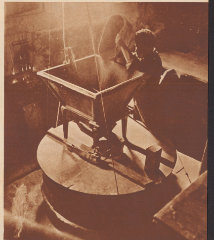
Im Innern der Mühle im oberen Stock, dort wo das Korn eingeschüttet wird. Es geht ohne Dynamo und ohne Transmissionen, ja fast ohne Eisen. Da meinet in Stein und Eisenholz. Draußen pumpt das Wasser über große Lauf. Ja, die Zahne des 80 Zentner schweren Wellenbaums sind aus Holz geblieben. Kein Ölpropfen, keine Purzwelle, ein bodenständige Werk in tiefstem Sinne des Wortes.

Unsere Aufnahmen zeichnen das Bild einer alten Kundenmühle am Gamsbad im Kanton Bern. Da wird noch nach alter Vater Süss Mehl gemischt. Kein Dynamo stört die alten Mühlsteine drehen sich von der Kraft des Wasserrades getrieben, und die Mühlenteere wehen am marmeladen Bad im Haase, drin schon ihre Väter und Großväter Korn gemahlen haben.