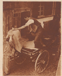
Ein junger Bauer hat im Herberweg zwei Sacke Korn zum Mahlen gebracht.

In einem kühlen Grunde, da geht ein Mühlerrad ... Ist es zu glauben und soll man's auf die leichte Achsel nehmen, daß dieser Lied oder vielmehr ein Gegenstand nun bald einer gänzlich verschwundenen Zeit angehört? 311 Handmühlen haben wir heute noch in der Schweiz, vor etwa 40 Jahren waren es deren 2420. In 40 Jahren sind nicht nur 2000 Mühlen verschwunden. Jedermann kann Beispiele aufzählen. Innerhalb dieser 311 übriggebliebenen Mühlen aber sind 90 ganz große, ohne Mühlrad, aber mit Motoren und allen neusten technischen Erfindungen. Diese Großmühlen vermehren den Löwenanteil (90%) des schweizerischen Brotes. Den restlichen 220 Mühlen droht ebenfalls der Untergang. An diesem fortschreitenden Niedergang schweizerischer Kleinmühlen sind: