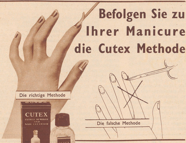
Die richtige Methode