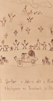
Er stand am Hauptstein, als die Velofahrer über den Berg liegen an. Mit offenen Armen begrüßten sie die Radfahrer.

Viels Größe an alle, und herzlich Gratulation den Preigewinnern! Euer Unggle Kolaktor.