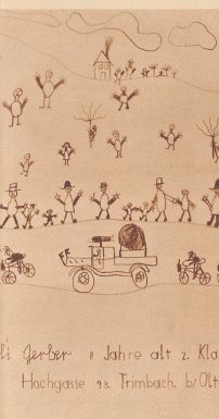
Es stand am Havenstein, als die Velofahrer über den Berg liegen an. Mit offenen Armen begrüßten sie die Radfahrer.