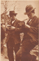
Die beiden haben den Preis für ihre Ablieferung schon anstandslos erhalten. Jetzt prüfen sie nach, ob die Rechnung stimmt.

ungeheuren Getreideüberfluß zu registrieren hat, ist die Förderung des Getreidebaus ein zweischneidiges Schwert im wirtschaftlichen Kampfe. Der Bauer mußte unbedingt garantieren, daß er für sein Getreide auch dann Absatz findet zu einem Preise, bei dem er betreiben kann. Wer sollte diese Garantien übernehmen? Der Bund. Mittler der Schweizer Bauer sein Getreide zum Weltmarktpreis abgeben, es würde für ihn den Reim bedeuten. So sah sich unser eidgenössisches Parlament vor die schwierige Tatsache gestellt, unserer Landwirtschaft einen Ueberpreis über den Weltmarktpreis zu gewähren. Der Bund wurde zum Großeinkäufer. Der Bauer fährt heute sein Getreide nicht mehr mit Rod und Wagen nur in die Mühle, sondern speziellen Güterwagen bereit, das Getreide aufzunehmen, nachdem es von den Beamten des Bundes aufs sorgfältigste geprüft und kontrolliert und gewogen worden ist. Damit sich der Leser ein ungefähres Bild von der Arbeit machen kann, die die Getreideübernahme verursacht, sei hier bloß erwähnt, daß im Jahre 1924 total 12800 Eisenbahnen zu 10 Tonnen verladen und abgeholt worden sind. Die Eidg. Getreideverwaltung hat also reichlich Arbeit. Der ganze Ankauf, das Verladen auf den unzähligen Bahnstationen, die Entlager in die Mühlen und Lagerhäuser muß gut vorbereitet und organisiert sein, um den Betrieb reibungslos abwickeln zu können. Unsere Bilder stammen von einer solchen Getreideübernahmestelle am Thunersee.