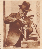
Der wichtigste Mann bei der Getreideübernahme: der Prüfer. Probeweise genommen er den Sack eine Handvoll Getreide, steckte daran, ließ es durch die Feinwaage gehen und legte es dann auf die Hebelwaage zum Feststellen, ob der Feuchtigkeitsgehalt den Vorschriften entspricht. Er hat eine feine Nase und kann von weitem riechen, ob das Korn Brandig ist, kann sagen, ob es im Isären oder Leimboden gewachsen ist und ob es bei gutem oder schlechtem Wetter geerntet wurde. Nach seinem Befehl wird der Preis festgesetzt.

Alles fließt... dieser Grundsatz der Philosophie des Heraklit, der das unansgesetzte Entstehen und Vergehen aller Dinge ausdrückt, bestätigt sich immer aufs neue. Nicht nur in der Philosophie, sondern auch auf dem Gebiet der Volkswirtschaft. Der Bauer, der früher sein Getreide pflanzte, fuhr es nach der Ernte mit Rod und Wagen in die Mühle. Der Müller war der Käufer. Wie der Krieg und die Nachkriegszeit mit unzähligen Traditionen gebrochen haben, so ist auch die Getreideversorgung unseres Landes gründlich geändert worden. Die Viehwirtschaft und die Milchwirtschaft, eine blühende Erwerbsquelle, haben an Überproduktion, sie allein vermögen den Bauern nicht mehr über Wasser zu halten. Ein Ausweg mußte gesucht werden, um der Landwirtschaft zu helfen. Man ging von der dominierenden Milchwirtschaft über zum Getreidebau. Das hatte aber auch seine Nachteile. In einer Zeit, die die Milchwirtschaft einen