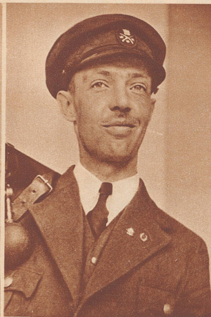
Rönnmark (Schweden) wurde mit 392 Punkten Weltmeister im Liegend-Schießen.