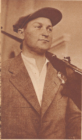
Miinalainen (Finnland) wurde mit 1111 Punkten und 56 Zehnern Weltmeister im Einzelklassement.