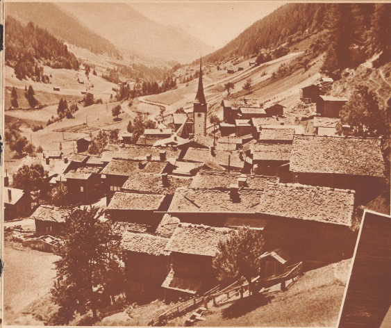
Niederwald im Oberwallis. Hier wurde Cesar Ritz als dreizehnter Kind der Familie geboren. Auf dem Friedhof ruhen seine Eltern und Großvater. Cesar Ritz selbst liegt in Luzern begraben. Das Dorf ist noch frei von Blödhörnern und Felssturzgefahr, und der «Heimatschutz» hat hier noch nichts zuzusetzen.