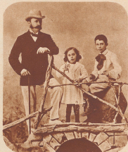
Aus dem Album. Das Bild zeigt Cesar Ritz mit seinen beiden Söhnen René und Charles in Sabaudgagne. Zu jener Zeit war Paul Dubouché der «Grand Hôtel des Termes». Er warhalf den dortigen Quellen zu ihrer Berühmtheit und ließ in jedem Stockwerk des Hotels Marmorböden einbauen.