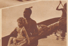
Völlig hingegen und herzerregend läßt sich Dadi mit den Schwarzen im Einbaum ermunterten gönnen.