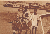
Der Dampfer läßt im Hafen von Massaua, Dadi steigen zu Land und wird dort von einem freundlichen Schwarzen auf ein zahnlos belächelndes gelbes und blaues die Dreckhülle geföhrt.