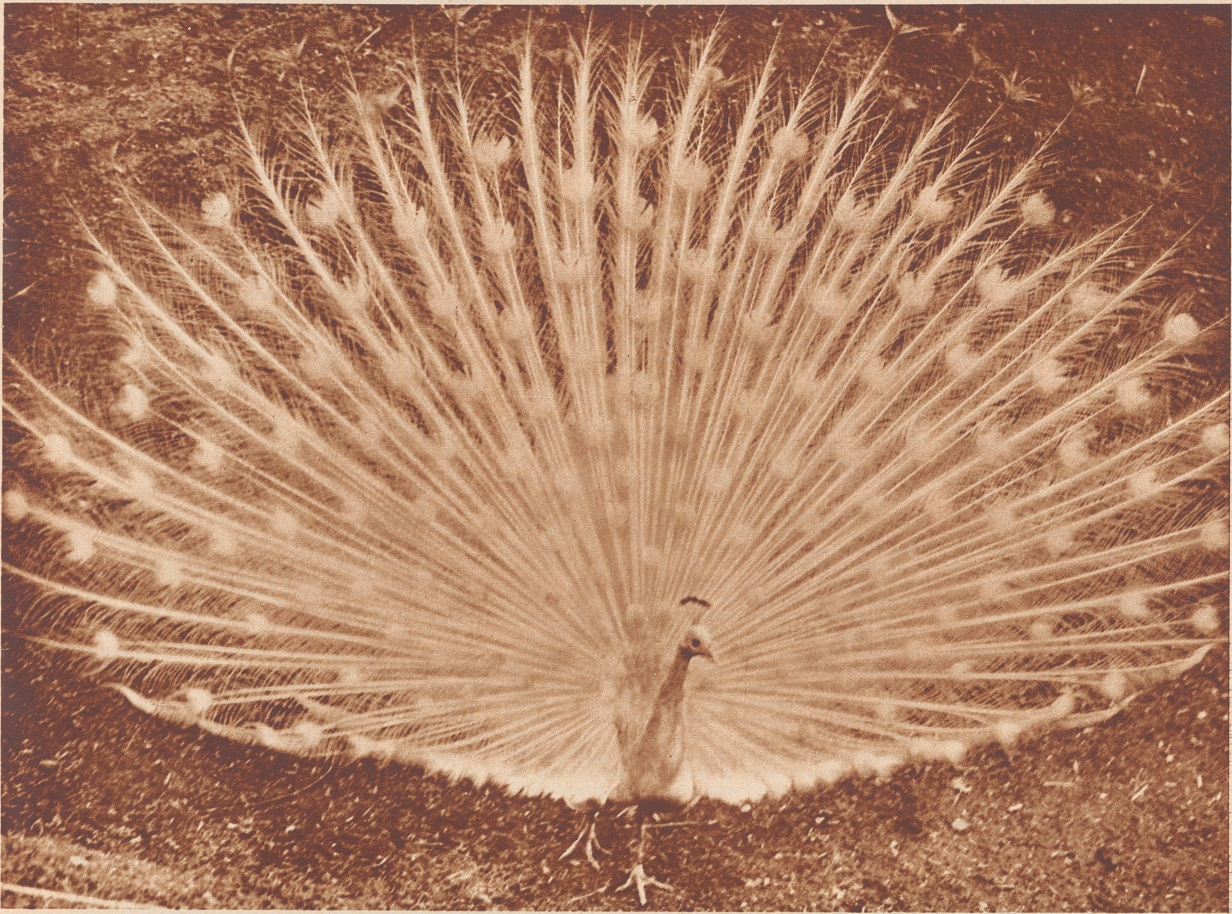
FEDERN Pfau im Berliner Zoo.