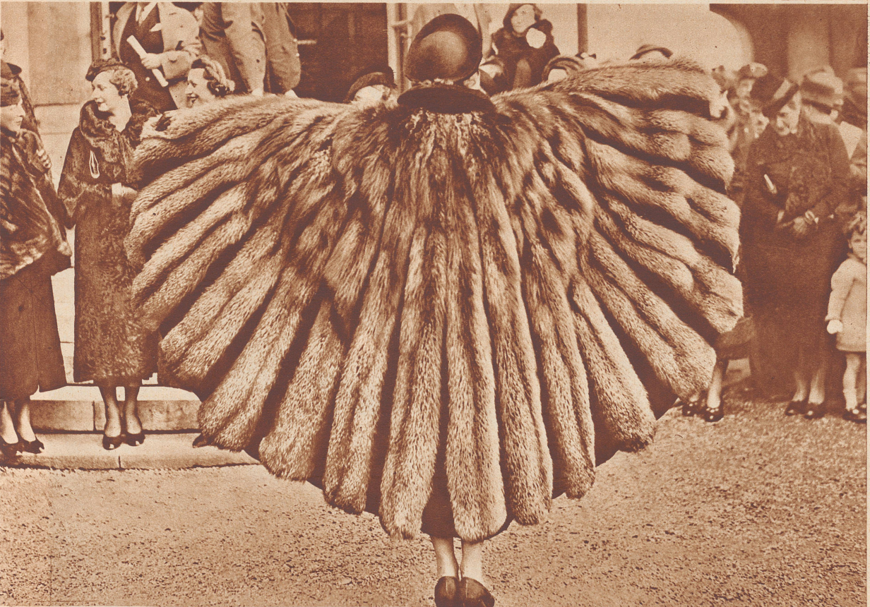
PELZ Silberfuchs-Mantel von einer Herbstmodeschau bei den Rennen in Longchamp.