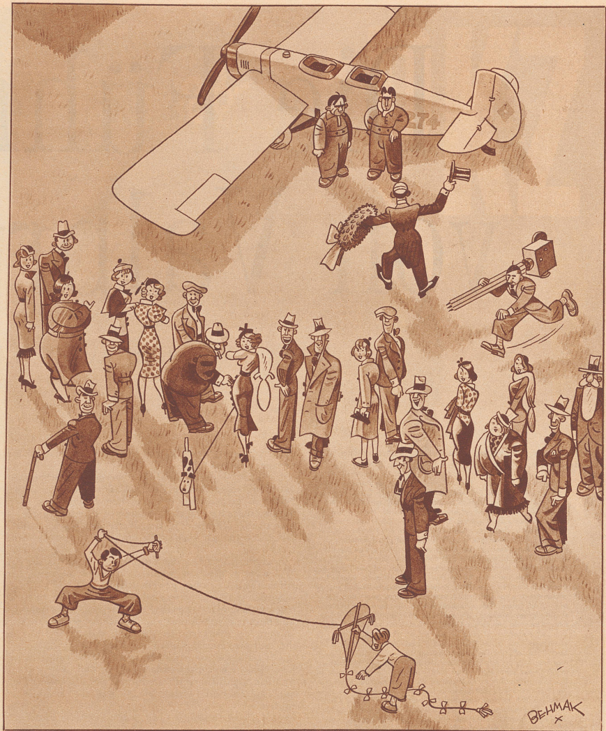
Die Ankunft des 365. Ozeanfliegers.

«Jü Gräezi au, gseht me Sie au wieder e mal, - ja, ja, me wird älter, gällesi?!»