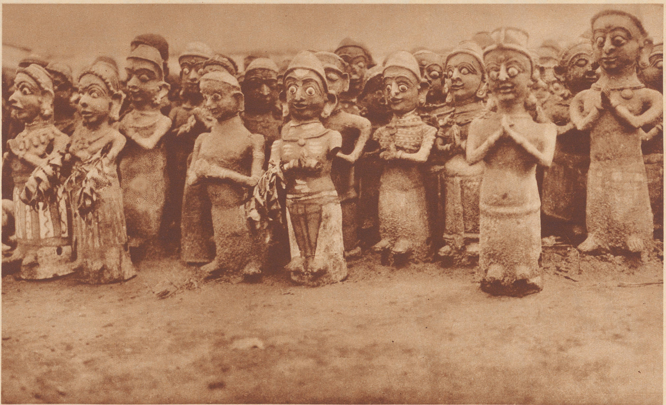
An einem Tempel der Pestgöttin Plague-amma von Madura in Südindien stehen Tausende solcher bemalter Tonfigürchen, welche bange Hindu-Mütter der Göttin opfereten, damit sie ihr Kleines verschone.