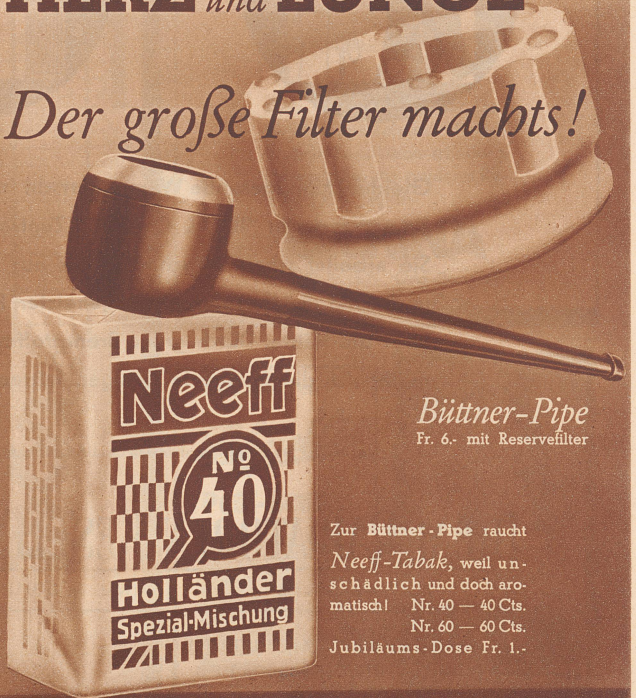
Büttner-Pipe Fr. 6.- mit Reservefilter

Zur Büttner-Pipe raucht Neeff-Tabak, weil unschädlich und doch aromatisch! Nr. 40 — 40 Cts. Nr. 60 — 60 Cts. Jubiläums-Dose Fr. 1.-