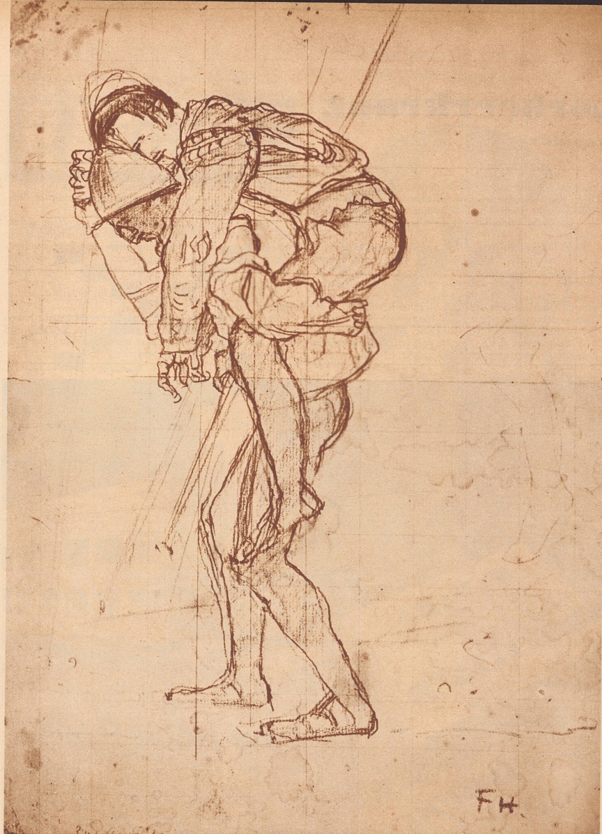
F. HODLER: STUDIE ZUM «RÜCKZUG VON MARIGNANO»

Aus der Ausstellung: «Schweizer Wandmalerei der Gegenwart»