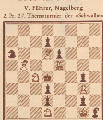
Matt in 3 Zügen

Unsere beiden Dreizüger behandeln ein selten bezwungenes Thema. Es lautet: «Es ist eine Zugwechselfolge zu verfassen von höchstens 4 Zügen. Im Verlaufe des Lösungsspiels soll Weiß nach dem ersten, zweiten oder dritten Verteidigungszuge erneut vor einer Zugwechselstellung stehen.» Die erste Zugwechselstellung ist in der Ausgangsstellung vorhanden; wäre Schwarz am Zuge, so könnte Weiß leicht mattsetzen. Die zweite tritt nach dem ersten Zuge von Schwarz ein. Es empfiehlt sich, zuerst Nr. 902, die leichtere der beiden Aufgaben, in Angriff zu nehmen.