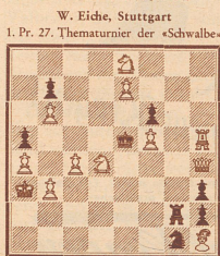
Matt in 3 Zügen