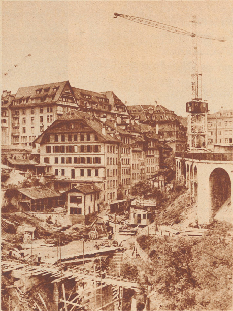
Das letzte Stündlein der alten Häuser am Gerber- oder Münzgraben beim Kasinoplatz hat nun geschlagen. Sie werden alle abgerissen, um einem gewaltigen, unterirdischen Garagenbau Platz zu machen. Der tiefe Graben, drin sie stehen, wird aufgefüllt, eine neue Promenade wird entstehen, der Kasinoplatz-Verkehr wird sich in ein wirbelndes Tempo hineinsteigern können. Im Vordergrund sieht man die ersten Fundamente des Großgaragenbaus. Bern im Umbau!