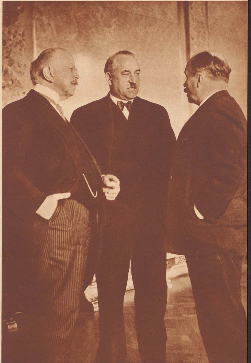
Drei bekannte Prominente im Bundeshaus.

Von links nach rechts: Nationalrat Dr. H. Walther, Luzern, Alterspräsident des Nationalrates, Bundesrat Obrecht und Nationalrat Musy im Gespräch während einer Sitzungspause.