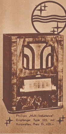
Philips „Multi-Inductance“-Empfänger Type 535, mit Kurzwellen, Preis Fr. 425.-

Die Ereignisse in der Welt überstürzen sich; was vor einer Stunde geschah, darüber weiß jetzt schon der Radioapparat zu berichten! Hören Sie die neusten Nachrichten im Rundfunk; Aktualitäten! Stimmungsberichte! Hören Sie sie aber mit einem guten Apparat, mit einem Philips-Empfänger; er vermittelt Ihnen jetzt schon in wenigen Sätzen die Berichte, die Sie erst morgen in den Zeitungen ausführlich lesen können!