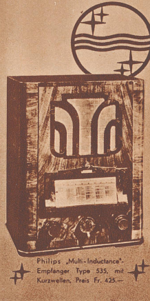
Philips „Multi-Inductance“-Empfänger Type 535, mit Kurzwellen, Preis Fr. 425.-

Die Ereignisse in der Welt überstürzen sich; was vor einer Stunde geschah, darüber weiß jetzt schon der Radioapparat zu berichten! Hören Sie die neusten Nachrichten im Rundfunk; Aktualitäten! Stimmungsberichte! Hören Sie sie aber mit einem guten Apparat, mit einem Philips-Empfänger; er vermittelt Ihnen jetzt schon in wenigen Sätzen die Berichte, die Sie erst morgen in den Zeitungen ausführlich lesen können!