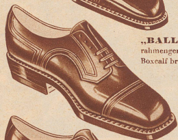
„BALLY JUBILÄUM“ rahmengenäht, Boxcalf schwarz, Boxcalf braun Fr. 21.80