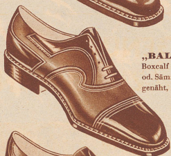
„BALLY GENT“ Boxcalf matt mit Lackleder od. Sämisch schwarz, rahmen- genäht, für den jungen Herrn Fr. 19.80