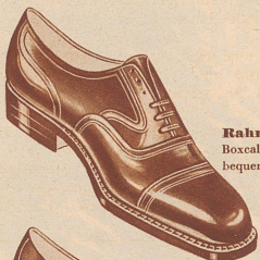
Rahmengenäht Boxcalf schwarz, bequeme Form Fr. 16.80

Der Mehrwert im Bally -Rahmenschuh liegt vor allem in der technischen Überlegenheit, im auserlesenen Material, in der bequemen Paßform und in seiner Schönheit, die Ihrer Persönlichkeit Geltung verschafft.