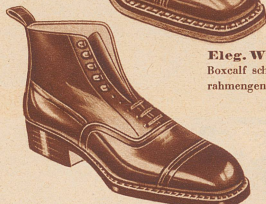
Eleg. Winterstiefel Boxcalf schwarz, ledergefüttert, rahmengenäht Fr. 19.80