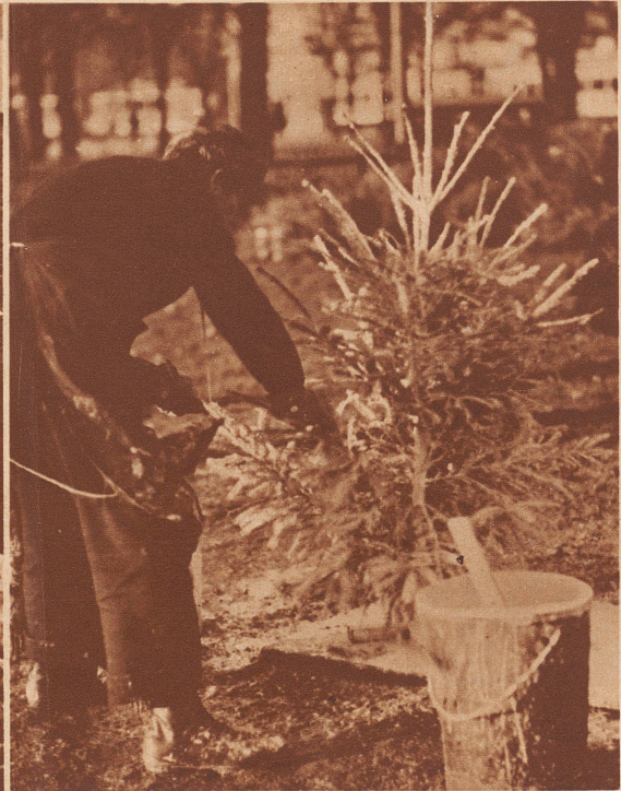
Rauhreif-Fabrikant am alten Tonhallplatz in Zürich.