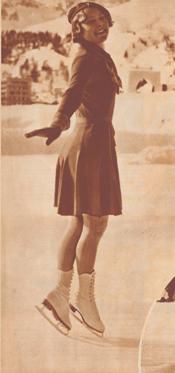
Sonja Henie (Norwegen), die Siegerin in den Europa-Meisterschaften der Damen.