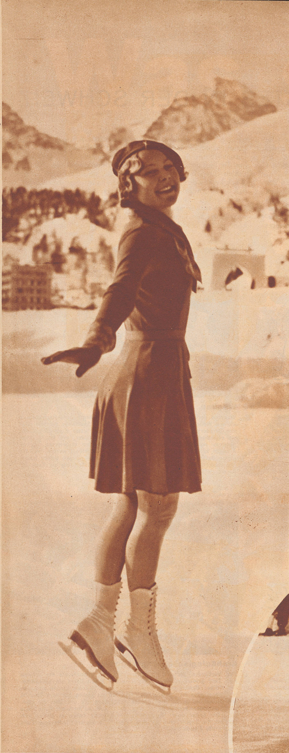
Sonja Henie (Norwegen), die Siegerin in den Europa-Meisterschaften der Damen.