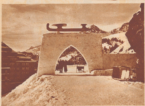
Das monumentale Eingangstor zum St. Moritzer Eisstadium, dem Schauplatz der Europa-Eiskunstlauf-Meisterschaften.