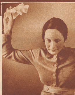
Weg muß der ganze Zettelmist!

Machen Sie also mit! Füllen Sie heute noch den nebenstehenden Bestellchein aus, damit Sie sofort das blaue Haushaltbuch erhalten.