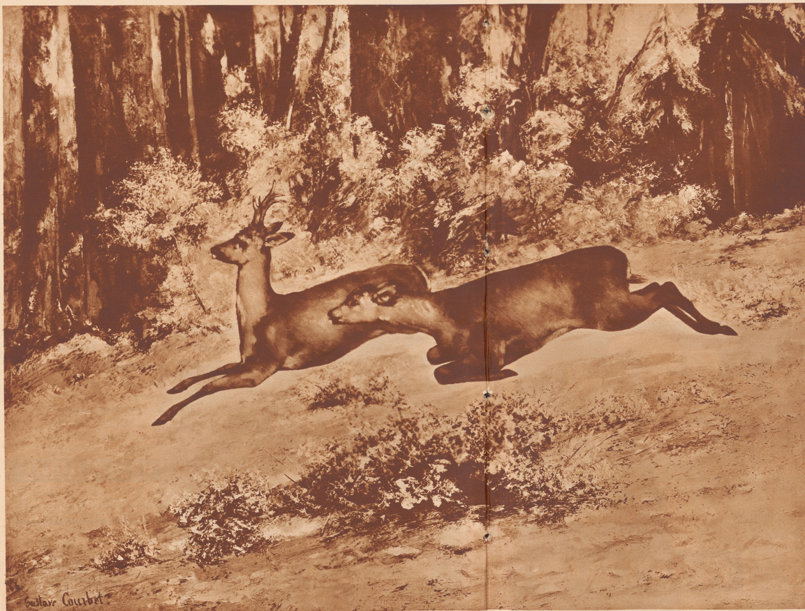
Winterlandschaft mit Rehen von Gustave Courbet, gemalt im Jahre 1866