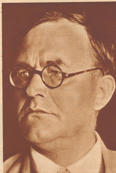
Prof. Dr. Karl Barth

Von Schladming an steigt die Straße, zwar nicht stark, aber dauernd. Man muß daher tüchtig treten; außerdem wirft der weiße Kalkstaub die Sonne nicht schlecht zurück. «Hundschinderei, verdammte! — Auto wäre angenehmer!» denkt der Mann in dem ziemlich abgetragenen Touristenanzug und späht über die Lenkstange rechts vorwärts, wo die schimmernde Front des Sonnhofes über dem Talboden sichtbar wird. «Ja, das wäre schon ein Bissen! Rechnen wir nur vierhunderttausend Schilling; zwei Prozent sind achttausend; wenn davon