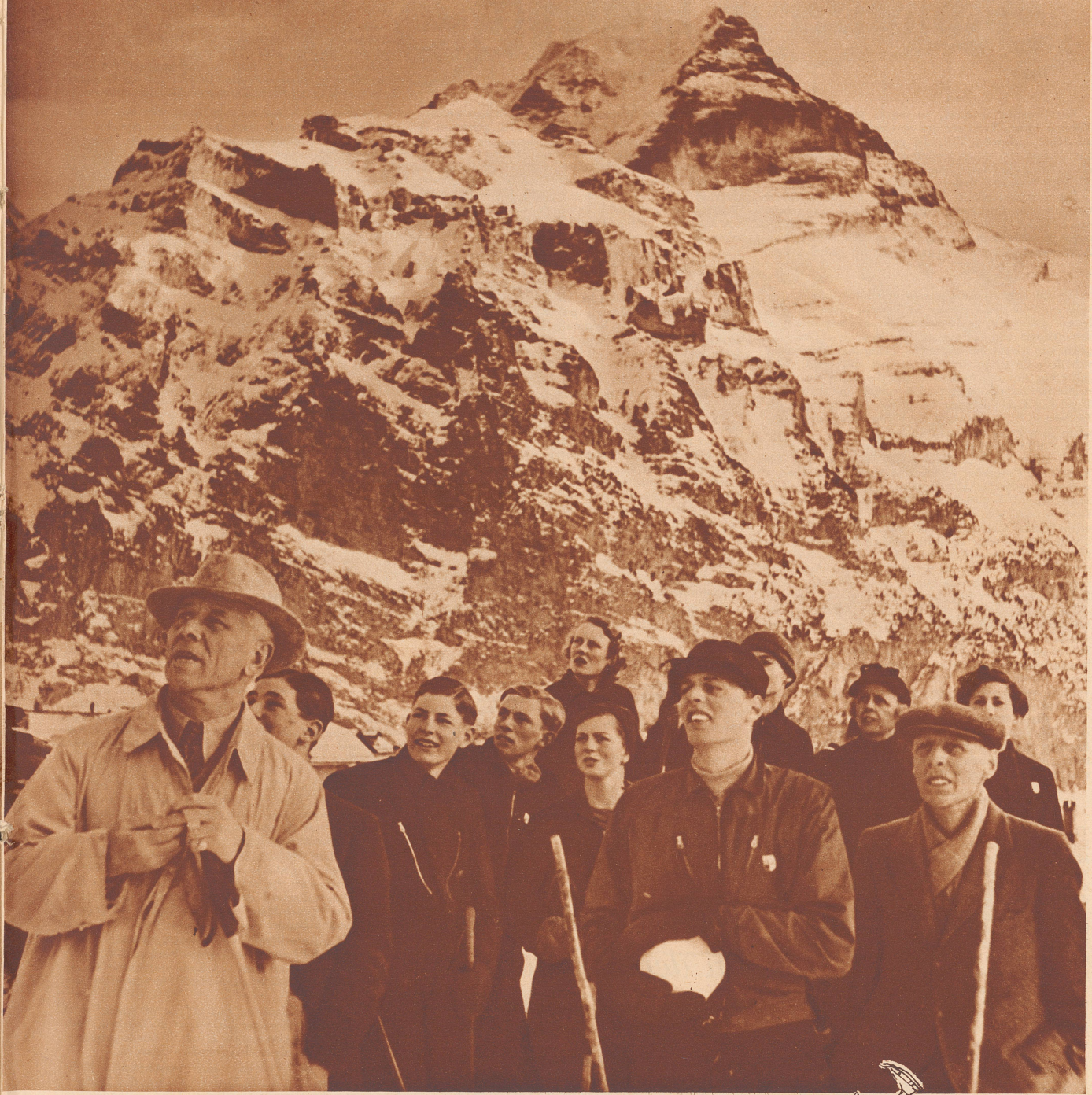
Englische Gäste als Zuschauer bei den Skiwettkämpfen des vorigen Sonntags in Mürren im Berner Oberland. Im Hintergrund die Jungfrau. Aufnahme Senn