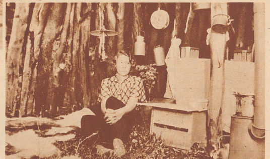
Die junge schwedische Lehrerin, die von Juni bis September die lappländischen Kinder im Sommerlager unterrichtet, wohnt in einer Erdhütte. Möbel hat sie nicht, sie schläft wie die Lappen auf Reisig und Renttierfellen.

Lehrer: «Walter, wie kommt es, daß dein Aufsatz über den Hund fast wörtlich mit der Arbeit von Fritz übereinstimmt?»