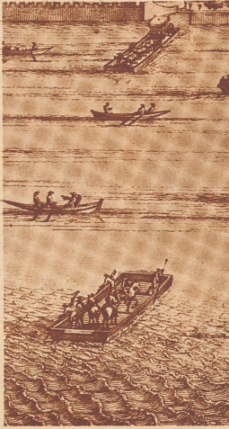
Westminster-Verkehr über die Themse vor dem Brückenbau.

«Bis zu meinem zwanzigsten Lebensjahre hörte ich kein Wort englisch» — so heißt es in der Einleitung eines Büchleins, das vor fast zweihundert Jahren Charles Labelye, Ingenieur und Brückenbauer in London, veröffentlicht hat.