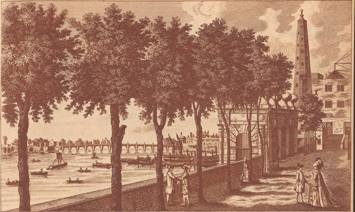
View of the STAIRS at YORK BUILDINGS in the Strand, with the WATER WORKS & a distant prospect of Westminster Bridge, &c.

Alter Stich. Blick auf die von Labeleye erbaute Westminster-Brücke.