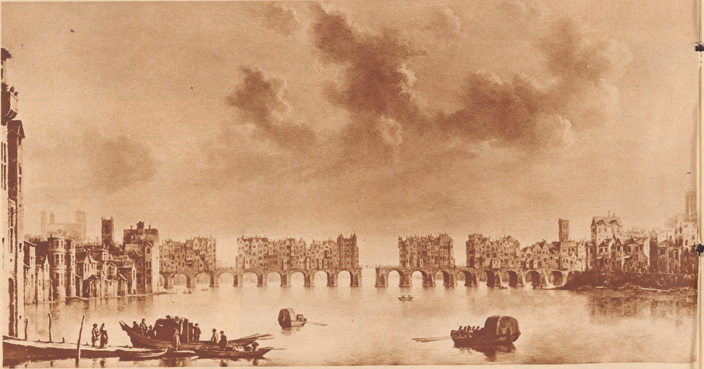
Die alte «London Bridge», lange Zeit die einzige Brücke über die Themse. Auf der London Bridge standen bis 1734 ganze Häuserblocks aus drei- bis vierstöckigen Wohngebäuden. In den Parterreräumlichkeiten befanden sich Geschäftslöke ähnlich wie heute noch auf der Arnobrücke in Florenz. Hauptsächlich Buchhändler hatten sich hier angesiedelt.

Ein grimmiger Feind Labelyes war der unbegabte, aber großsprecherische Architekt Batty Langley, der es nicht ertragen konnte, daß nicht er mit dem Bau des Westminster-Bridge beauftragt wurde. Als im Jahre 1748 ein Bogen der Brücke barst, veröffentlichte Batty Langley rasch ein Büchlein unter dem Titel «Survey of the Westminster Bridge», auf dessen erster Seite er von Labelye als von dem «Schweizer Betrüger» sprach. Als Titelblatt trug das Büchlein eine Zeichnung, auf der ein Fragment der Westminster-Brücke zu sehen war, «wie sie hätte gebaut werden sollen auf Grund der Veröffentlichung Batty Langleys im Jahre 1736». Unter einem Bogen zeichnete Langley einen Galgen hin, an den er den gehäßten Konkurrenten Labelye kurzweilig aufhängte. Unter der Zeichnung steht ein Dialog zwischen dem Unternehmer und dem Ingenieur (Labelye). Im Dialog nennt der Unternehmer seinen Ingenieur einen gemeinen Kerl und frechen Betrüger. In Wirklichkeit hat der Unternehmer nach Abschluß der Arbeiten Labelye reich beschenkt, auch wurden bei den Eröffnungsfeierlichkeiten dem Brückenbauer die größten Ehren zuteil. Langleys Angriffe beruhten ausschließlich auf dem ohnmächtigen Neid eines Dilettanten.