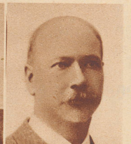
† Louis Maurer bedeutender Unternehmer der Holzbranche und langjähriger Schweizerkonsul in Lima (Peru), starb vor kurzem in San Francisco.