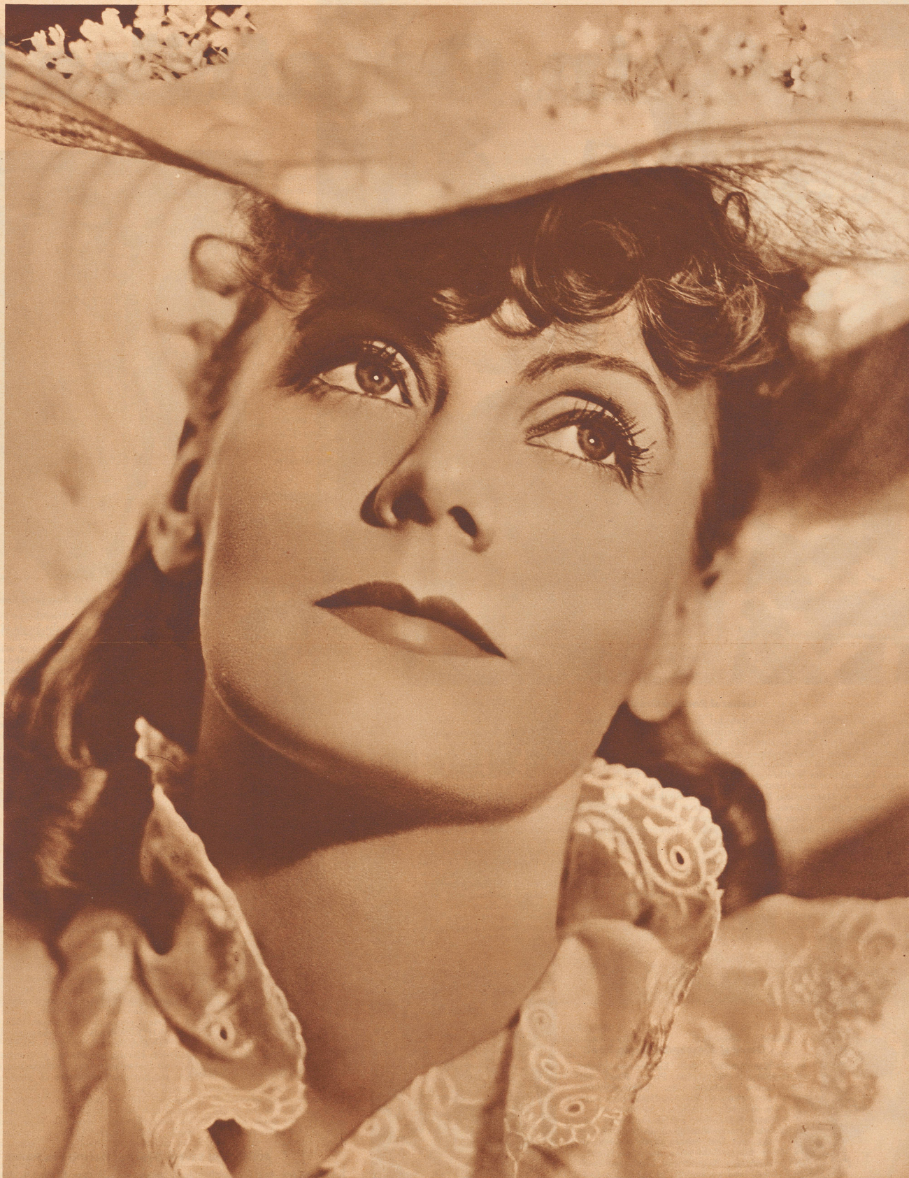
Greta Garbo als Anna Karenina