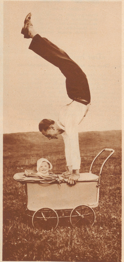
«Finden Sie Verwendung für das beigelegte Bild, es ist aus lauter Freude am nahenden Frühling entstanden», schrieb uns der Herr Einsender zu diesem Bild.