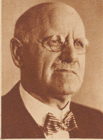
Gottlieb Felder ehemaliger Lehrer an der Mädchenrealschule St. Gallen und verdienter Geschichtsforscher, ist zum Ehrendoktor der Universität Zürich ernannt worden.