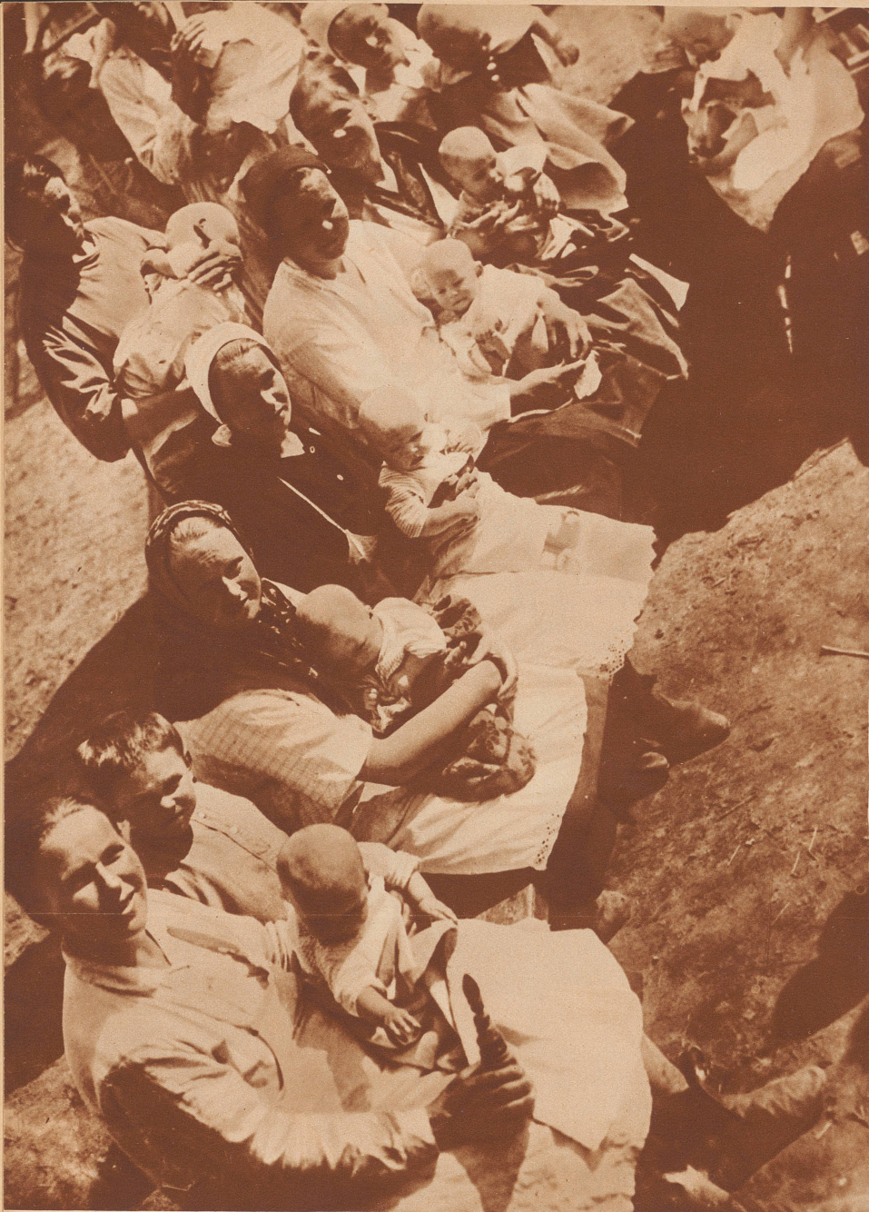
Auf den Bänken im Garten eines Säuglingsheims in Moskau.