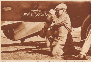
Rechts: Schwere Beobachtungsmaschine mit der Aufhängewindung für große Sprengbomben. Sie können vom Beobachter aus durch einfache Manipulationen ausgelöst werden, wenn das Flugzeug sich über dem zu bombardierenden Erdteil befindet.