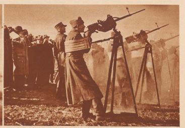
Fliegeroffiziere bei der Verführung von Fliegerabwehr-Maschinengewehren