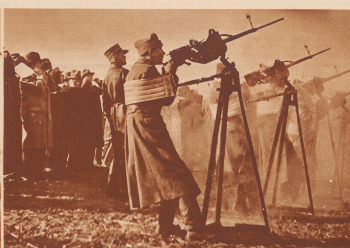
Fliegeroffiziere bei der Vorführung von Fliegerabwehr-Maschinengewehren