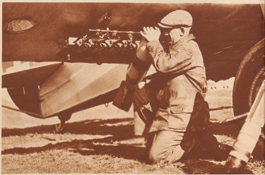
Rechts: Schwere Beobachtungsmaschine mit der Aufhängungsvorrichtung für große Sprengbomben. Sie können vom Beobachter aus durch einfache Manipulationen ausgelöst werden, wenn das Flugzeug sich über dem zu bombardierenden Erdteil befindet.