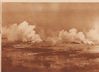
Die Zeitgenossen nach der Explosion der abgeworfenen Bomben.