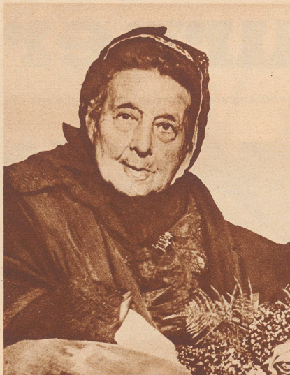
† Marianne Hainisch