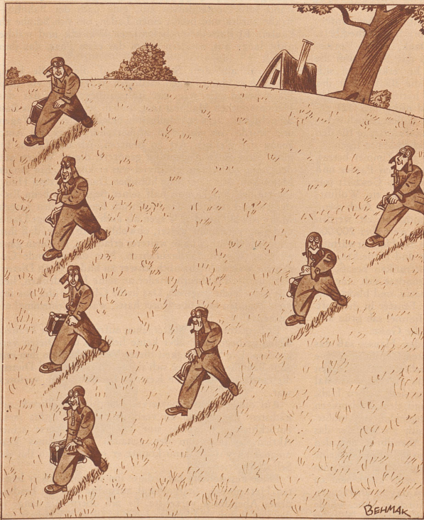
Die Macht der Gewohnheit

Die Piloten der Flugzeugstaffel 13 gehen ins Weekend.