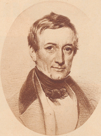
Peter Mark Roget

Nach einem alten Stich Man beachte die Ähnlichkeit P. M. Rogets mit seinem Onkel Sir Samuel Romilly (Bild rechts unten).