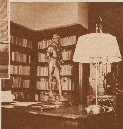
Blick in die reichhaltige Bibliothek des künftigen französischen Ministerpräsidenten.