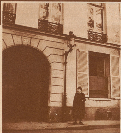
Der Eingang zur Wohnung Léon Blums, 25, Quai de Bourbon, Paris.

Léon Blum überlegt. Ein Blick aus dem Fenster auf die Straße.