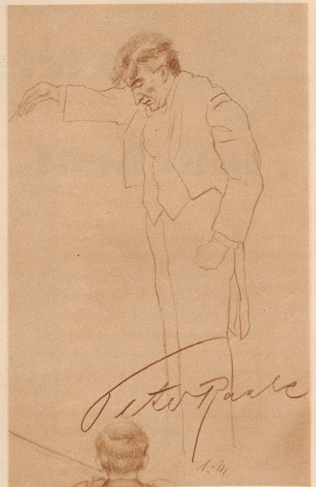
Dr. Peter Raabe Präsident der Reichsmusikkammer und Musikschritsteller.