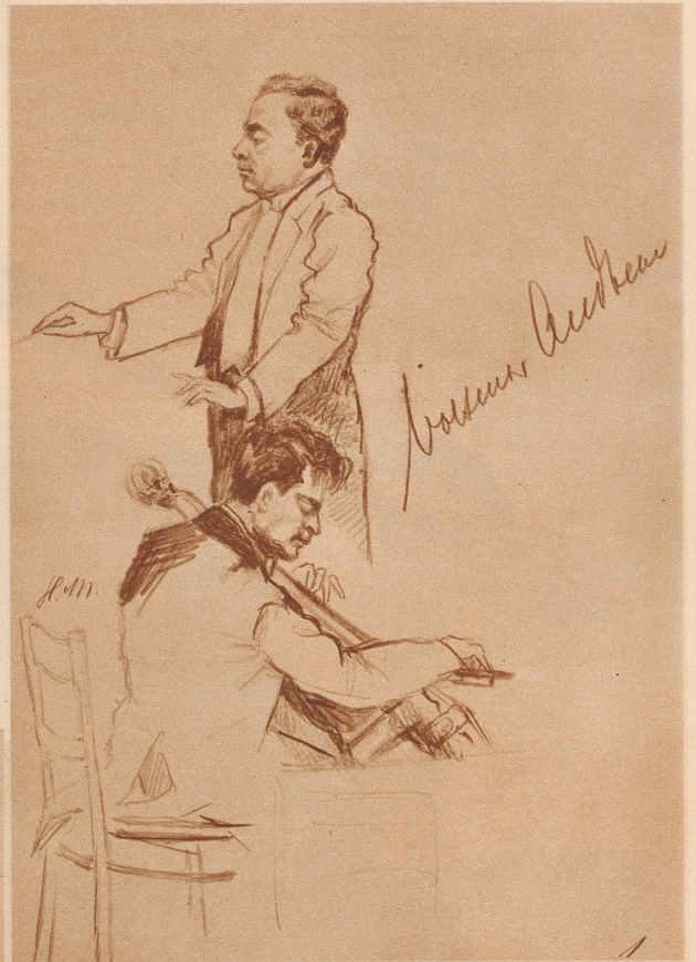
Dr. Volkmar Andreae Leiter des Tonhalleorchesters, Dirigent des Gemischten Chores Zürich und Direktor des Zürcher Konservatoriums für Musik.